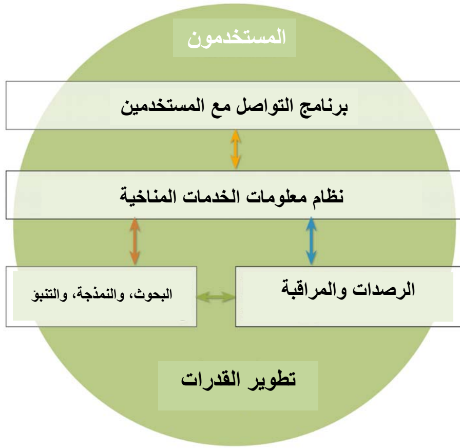
الشكل 1: عناصر الإطار العالمي للخدمات المناخية (GFCS)

وسوف توفر الأولويات والأنشطة المبينة في هذا المثال النموذجي المعلومات عن التطورات التي تتحقق في الدعائم الأخرى في الإطار وتستفيد منها، وتفحص بدورها مدى صلتها بهذا المثال النموذجي: